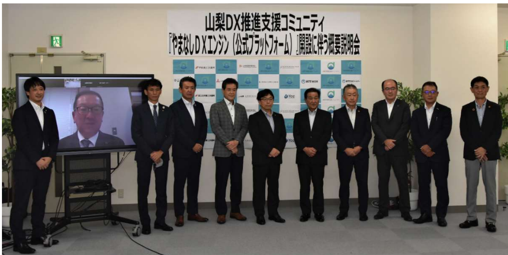
【山梨DX推進支援コミュニティ 構成員】